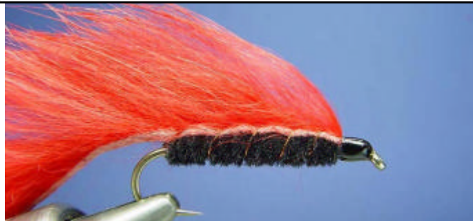
ETAPE 11 : Formez la tête puis vous la vernissez.