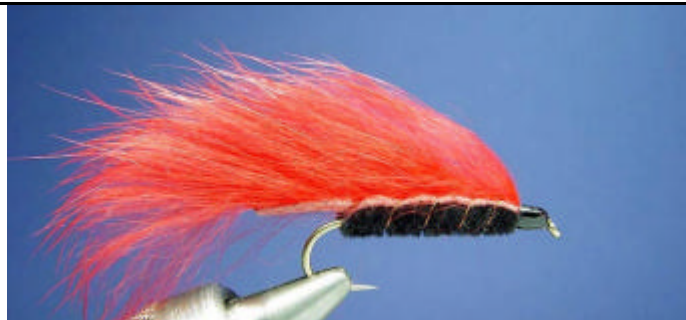
ETAPE 12 : Coupez la bande de lapin pour formez la queue. Mouche terminée. Excellente mouche pour le réservoir à décliner en plusieurs couleurs.