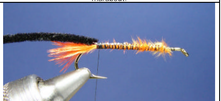
ETAPE 6 : Attachez la chenille sur l'hameçon