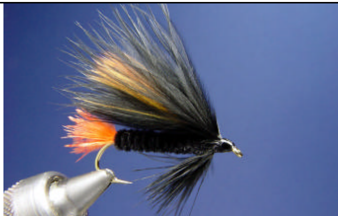
ETAPE 12 : Terminez la mouche par un nœud final et une goutte de super glue