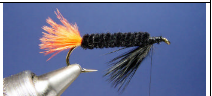
ETAPE 8 : Formez la gorge avec du marabout noir