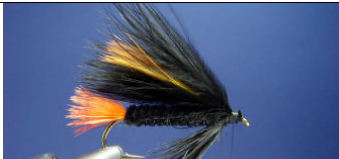
ETAPE 11 : Finissez l'aile par une 2e touffe de marabout noir.