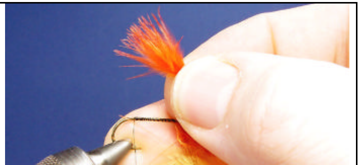
ETAPE 2 : Prenez une plume de marabout orange et regroupez les fibres de la pointe de la plume.