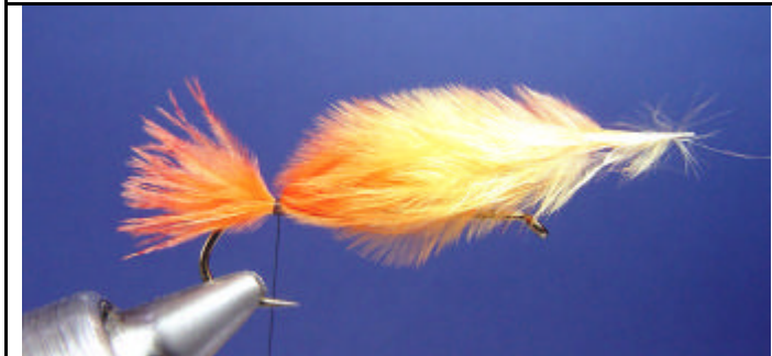
ETAPE 3 : Attachez le marabout pour former la queue.