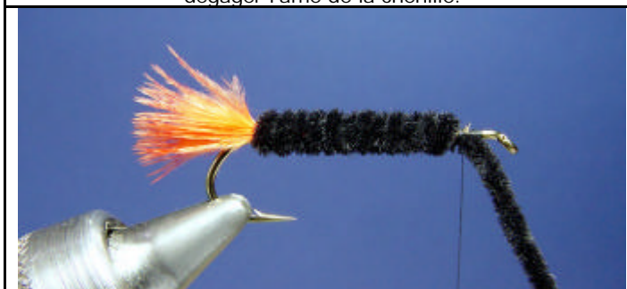
ETAPE 7 : Enroulez la chenille pour former le corps