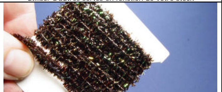
ETAPE 10 : Prenez de la chenille fritz ou cactus chenille noire.