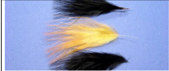
ETAPE 3 : Prélevez les pointes de 2 plumes noires et 1 plume orange.