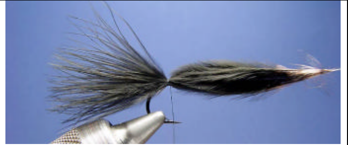
ETAPE 4 : attachez une plume noire.