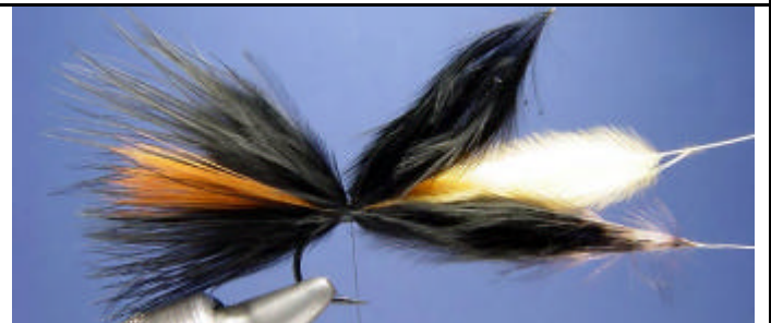
ETAPE 6 : Puis attachez la 2e plume noire.