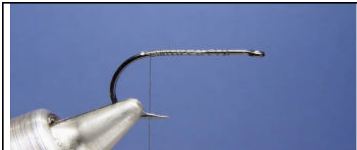
ETAPE 1 : Placez dans votre étau un hameçon n°8 tige courte.