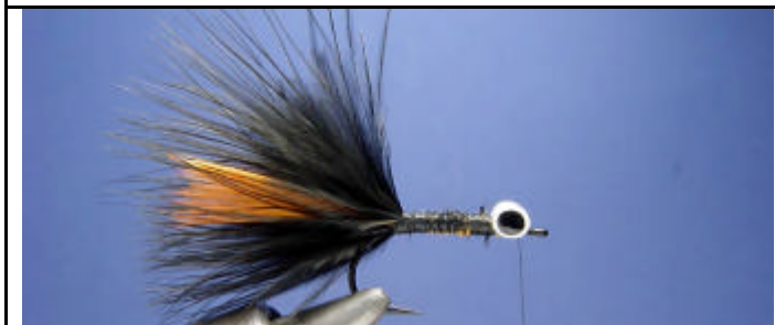
ETAPE 9 : Vue de côté.