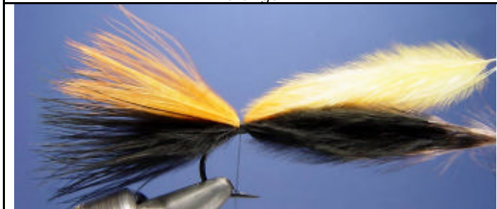
ETAPE 5 : Attachez par dessus la plume orange