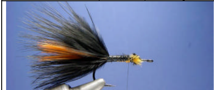
ETAPE 7 : Coupez la base des plumes et liguez ce qui reste sur la hampe de l'hameçon