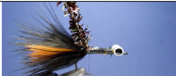
ETAPE 11 : Attachez la chenille fritz.