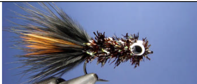
ETAPE 12 : Enroulez la chenille et finissez la mouche par un noeud final et une goutte de super glu.