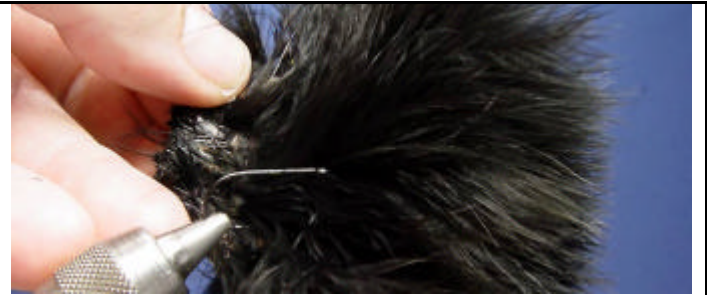
ETAPE 2 : Prenez du marabout noir.