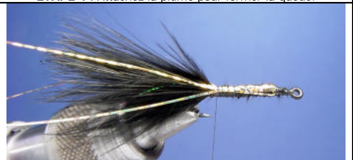
ETAPE 6 : Attachez 3 ou 4 filaments de flashabou holographique or au niveau de la queue.