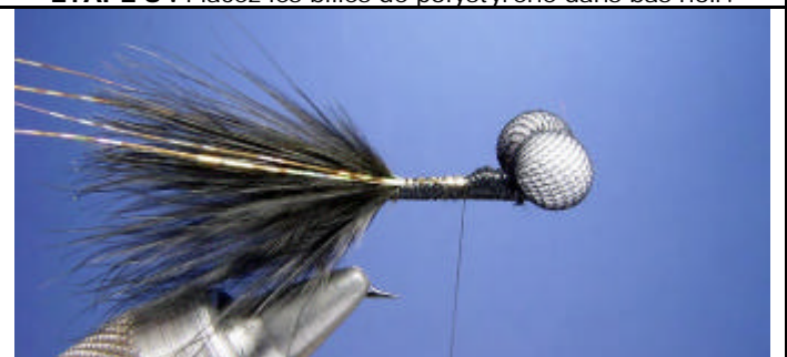
ETAPE 10 : Coupez le bas qui reste.