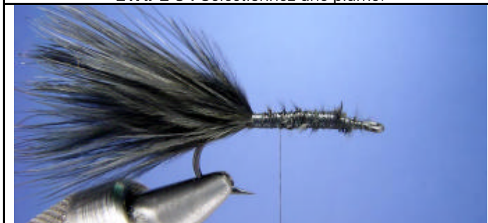
ETAPE 5 : Formez un sous corps avec la base de la plume.