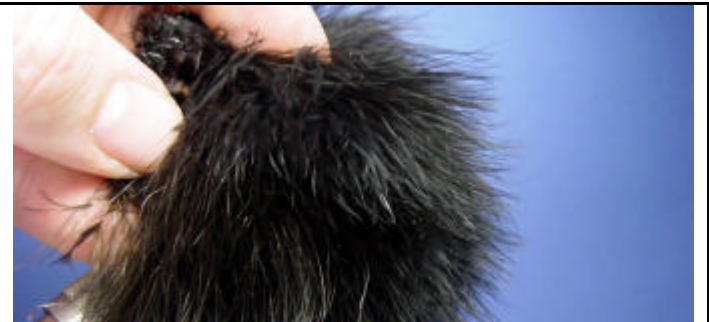
ETAPE 2 : Prenez du marabout noir.