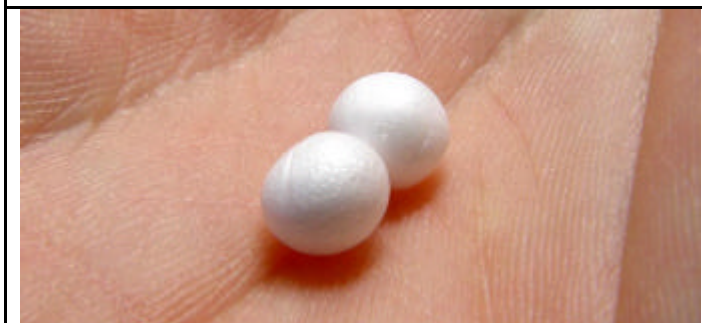
ETAPE 7 : Sélectionnez 2 billes de polystyrène assez grosses.