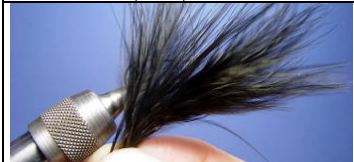
ETAPE 3 : Sélectionnez une plume.