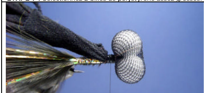
ETAPE 9 : Attachez le bas plus les billes, ligaturez bien pour