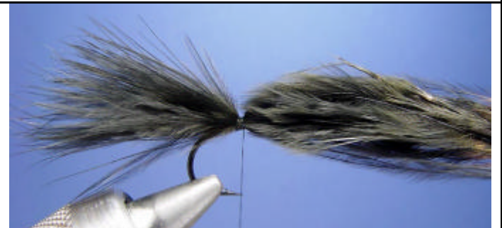
ETAPE 4 : Attachez la plume pour former la queue.