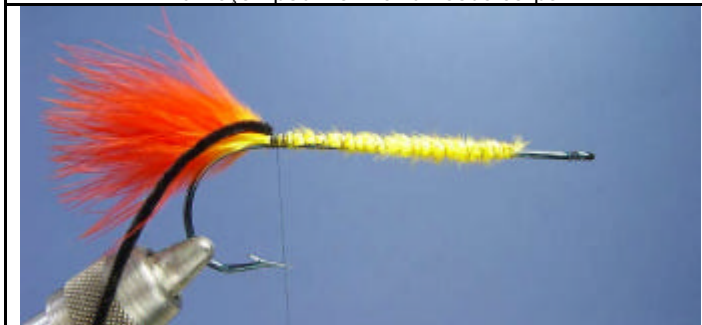
ETAPE 5 : Attachez un brin de suède chenille noire (assez long si vous voulez finir la mouche).