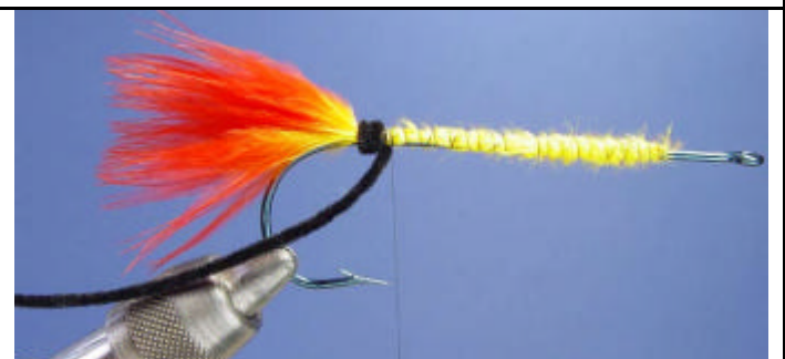
ETAPE 8 : Mettez la chenille en position d'attente.