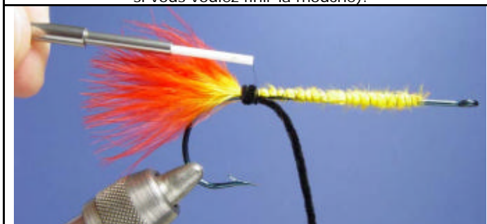
ETAPE 7 : Bloquez la chenille avec le fil de montage (2, 3 tours suffisent).