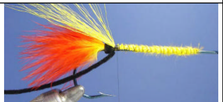
ETAPE 10 : Coupez la base des poils et faites quelques tours