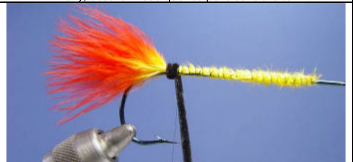
ETAPE 6 : Faites 2 tours de chenille.