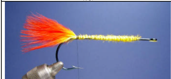
ETAPE 3 : Ligaturez le marabou sur toute la hampe de l'hameçon pour former un sous corps.