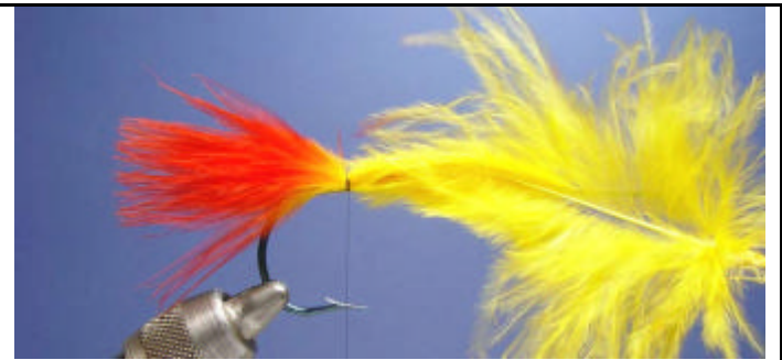
ETAPE 2 : Formez une queue avec du marabou rouge.