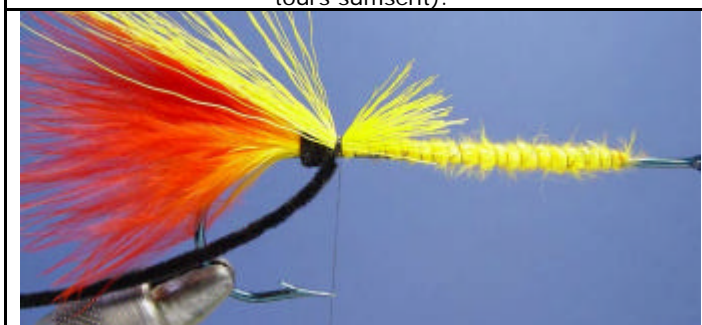
ETAPE 9 : Attachez une touffe de bucktail jaune contre la