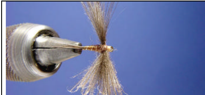
Enroulez le dubbing pour former le thorax.