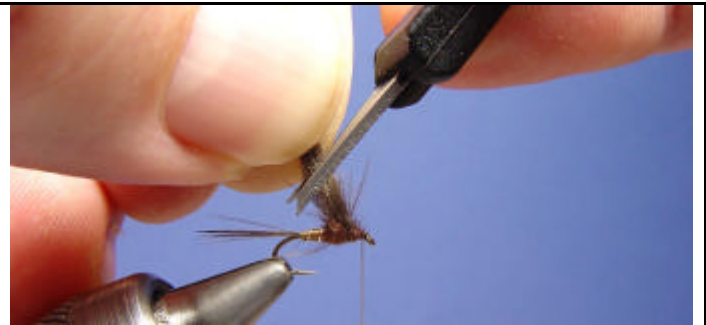
Prenez les 2 ailes ensemble et coupez les à la bonne longueur.