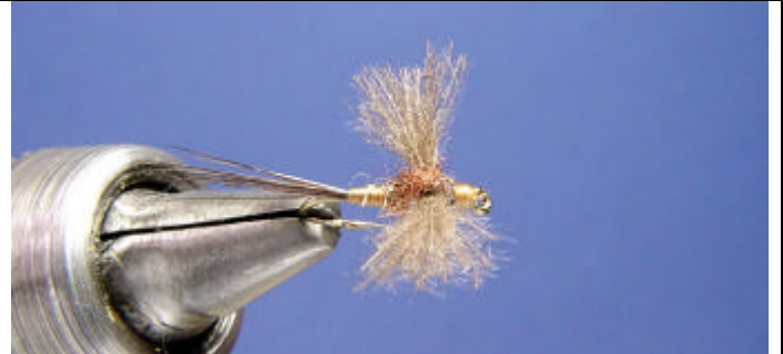
Finissez la mouche par un noeud final et une goutte de super glue.