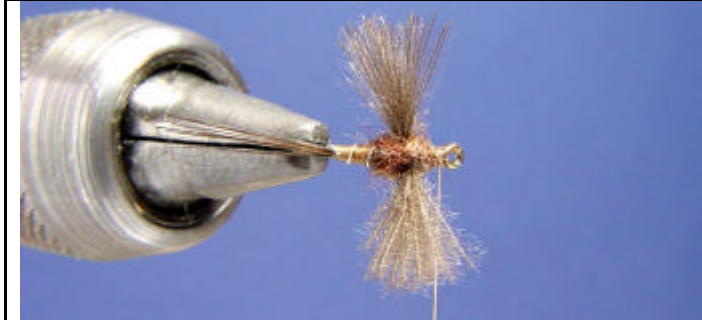
Taillez les ailes pour leur donner leurs formes définitives.