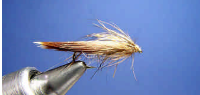
ETAPE 15 : Finissez la mouche par un nœud final et une goutte de super glue.