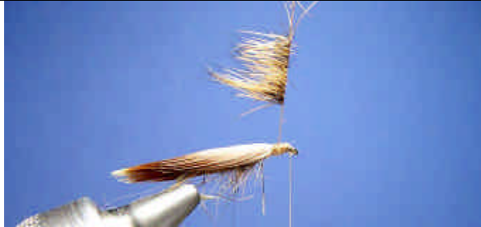
ETAPE 13 : Rabattez tous les poils vers l'arrière.