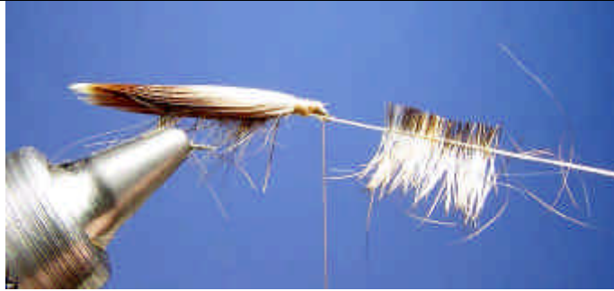
ETAPE 11 : Coupez la base des poils.