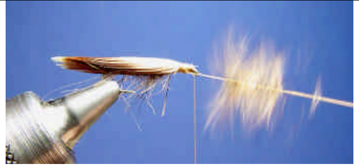
ETAPE 12 : Torsadez les poils.