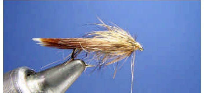
ETAPE 14 : Enroulez les poils.