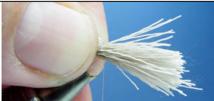
ETAPE 3 : Placez cette touffe au dessus de l'hameçon et légèrement sur le côté puis faite un premier enroulement avec la soie de montage sans la serrer.