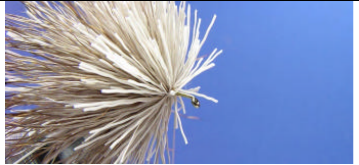
ETAPE 10 : Recommencez et arrêtez vous un peu avant l'oeillet.