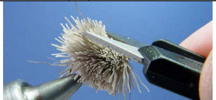
ETAPE 14 : Pour la finition je vous conseil d'utiliser des petit ciseaux. Je commence toujours mon taillage de finition en plaçant le ciseau comme sur la photo. Cette position va donner une forme en v au corps de la mouche. L'utilisation d'un étai rotatif facilitera le travail.