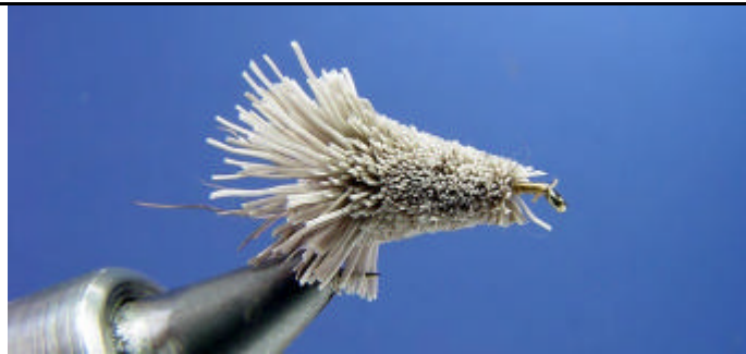
ETAPE 15 : Vous obtenez cela.