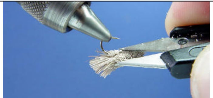
ETAPE 16 : Retournez la mouche et dégagerez l'oeillet.