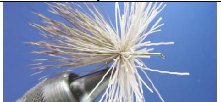
ETAPE 6 : Quand le fil de montage se trouve devant les poils vous pouvez relâcher les poils de chevreuil de votre main gauche.