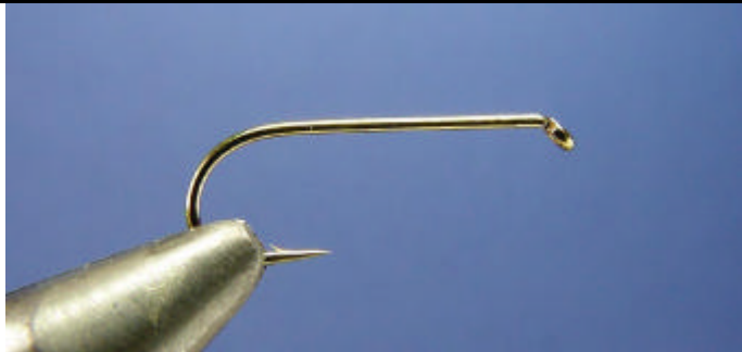
ETAPE 1 : Placez dans votre étai un hameçon N° 12.

Voici le montage d'une mouche que tout pêcheur à au moins utilisée une fois dans sa vie. Mouche très efficace mais qui présente une difficulté de montage qui est de faire un corps en poils de chevreuil. Beaucoup de débutants butent sur se problème et j'espère que cette page va leurs apporter plus de lumière.