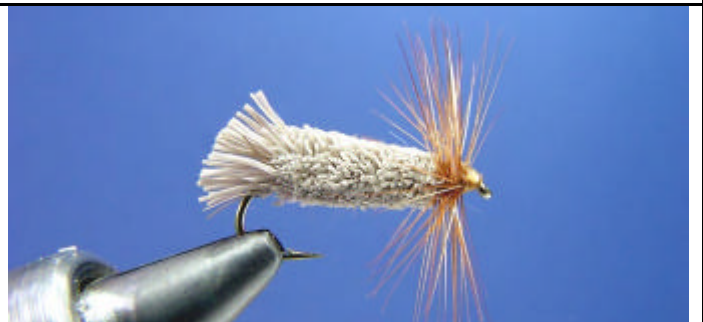
ETAPE 22 : Finissez votre mouche par un noeud final et une goutte de super glu.