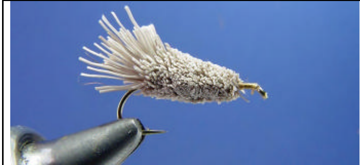
ETAPE 17 : Les poils en dessous de la mouche peuvent être coupés horizontalement. Ceci est une question de goût personnel.