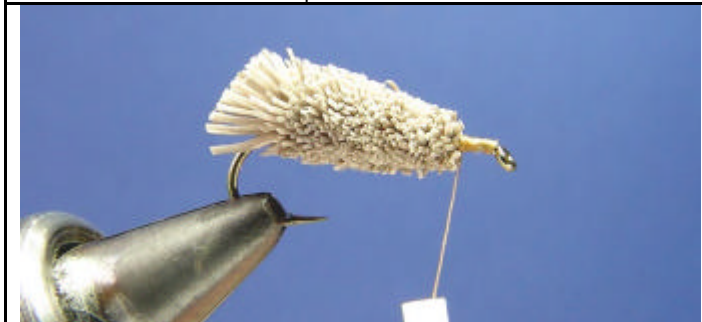
ETAPE 19 : Reprenez la mouche avec votre fil de montage.