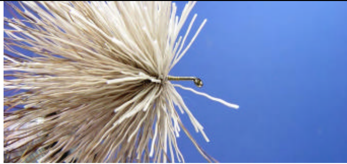
ETAPE 9 : Vous obtenez cela.