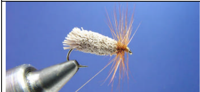
ETAPE 21 : Enroulez la plume.