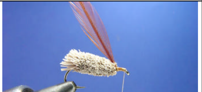
ETAPE 20 : Attachez une plume WHITING FARMS de couleur roux.