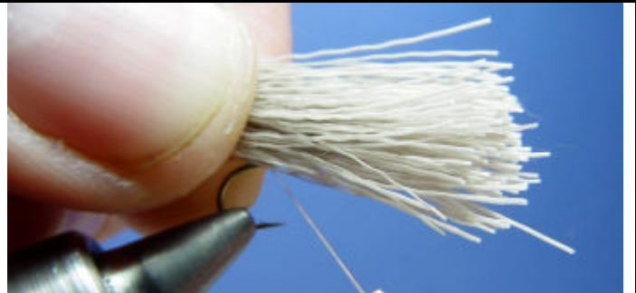
ETAPE 2 : Prenez une touffe de poils de chevreuil. Pas trop petite si vous un corps assez dense.