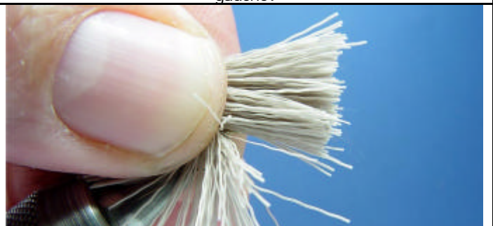
ETAPE 8 : Prenez une autre touffe d poils et recommencer l'opération.