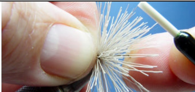
ETAPE 5 : Passez 2 ou 3 fois votre fil de montage sur les poils tout en remontant vers l'oeillet. Vous gardez toujours la pression sur vos doigts de la main gauche.