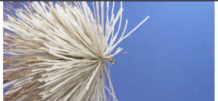
ETAPE 12 : Vous allez gagner de la place et vous pourrez alors placez une autre touffe de poils. Laissez suffisamment de place pour la collerette.