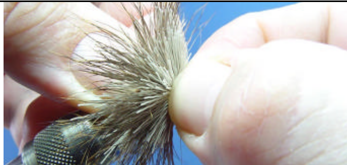
ETAPE 11 : Placez vos doigts de la main gauche derrière la mouche et avec ceux de la main droite poussez les poils pour les tasser.