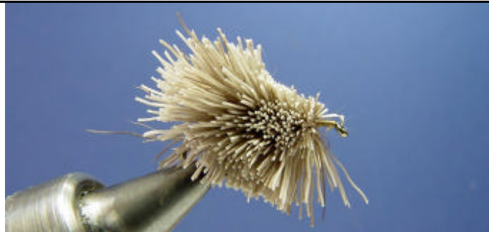
ETAPE 13 : Avec des ciseaux dégrossissez le corps de la mouche. Le taillage du poils de chevreuil est une opération délicate, un coup de ciseaux mal placé peu tout ruiner. Alors prudence.