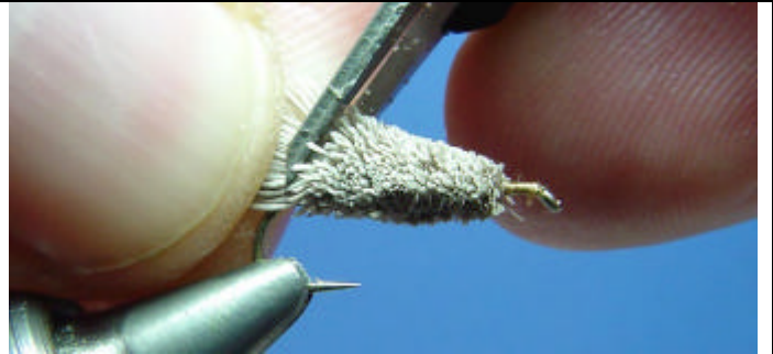
ETAPE 18 : Prenez les poils en queue de la mouche et taillez les. C'est à vous de choisir la longueur.