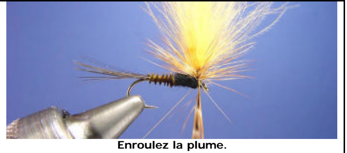
Enroulez la plume.