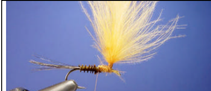
Enroulez le quill de dinde.