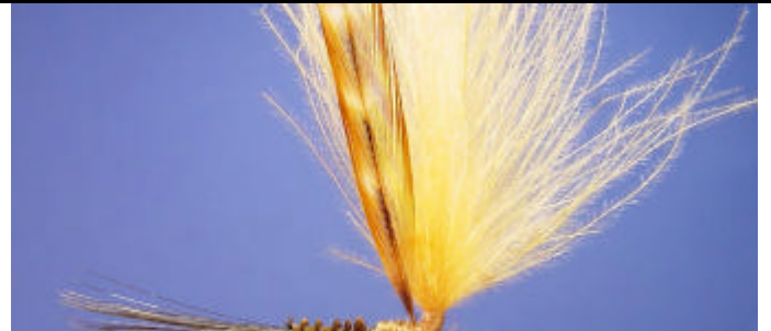
Attachez une plume WHITING FARMS chinchilla roux.