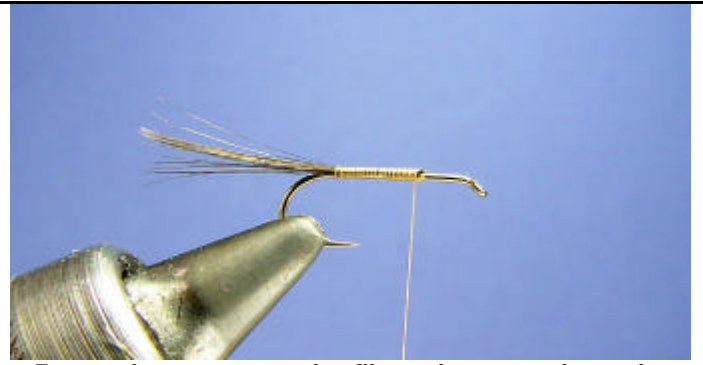
Formez la queue avec des fibres de coq ou de pardo.