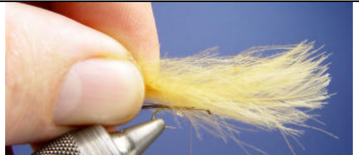
Placez vos 2 plumes de CDC au dessus de l'hameçon.