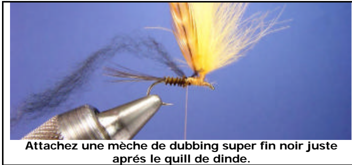
Attachez une mèche de dubbing super fin noir juste après le quill de dinde.