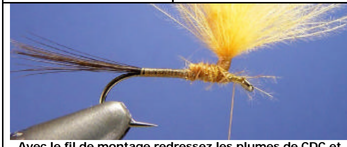
Avec le fil de montage redressez les plumes de CDC et faites une enroulement à la base des plumes de CDC.