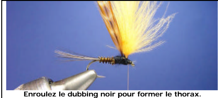
Enroulez le dubbing noir pour former le thorax.