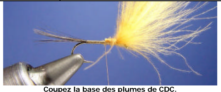
Coupez la base des plumes de CDC.