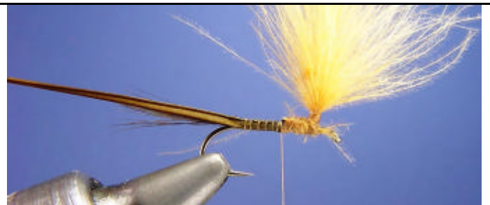
Attachez sur le corps un quill de dinde olive foncé.