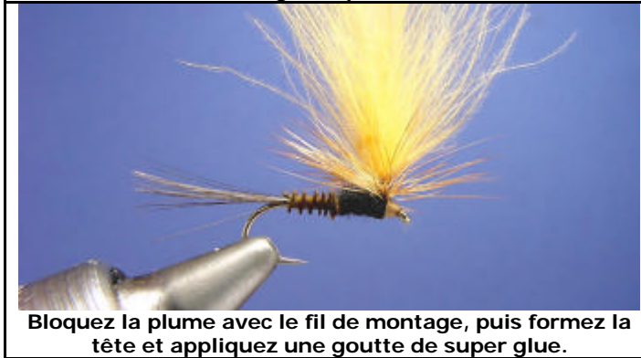
Bloquez la plume avec le fil de montage, puis formez la tête et appliquez une goutte de super glue.