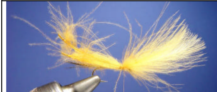
Attachez les plumes de CDC.