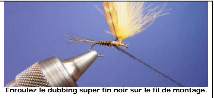
Enroulez le dubbing super fin noir sur le fil de montage.