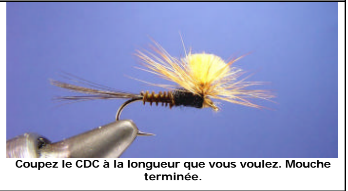
Coupez le CDC à la longueur que vous voulez. Mouche terminée.