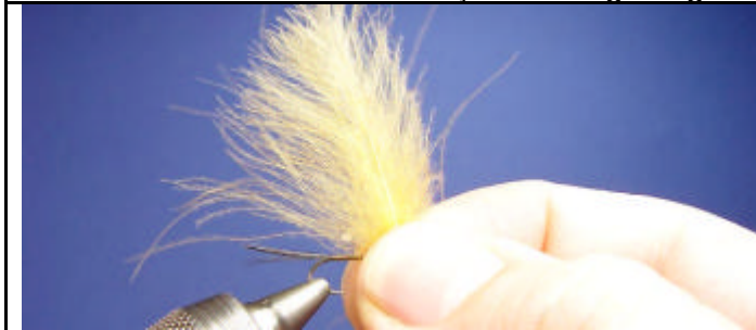
Sélectionnez 2 plumes de CDC jaune.