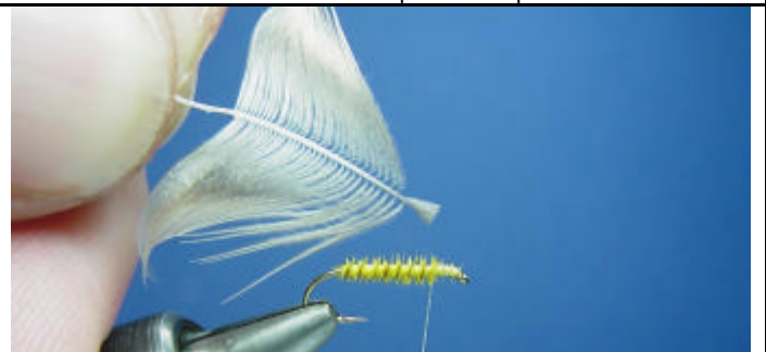
ETAPE 6 : Coupez l'extrémité de la plume.