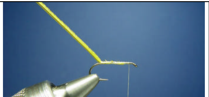
ETAPE 2 : Attachez un quill teint jaune.