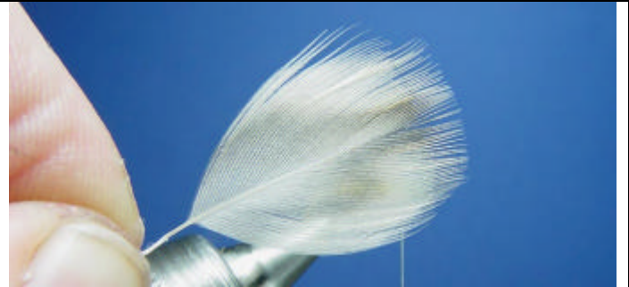
ETAPE 4 : Sélectionnez une plume de poitrail de cane.