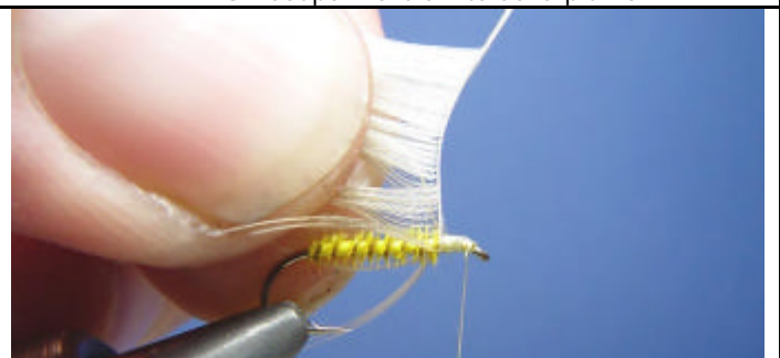
ETAPE 8 : Rabattez toutes les fibres vers l'arrière.