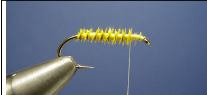
ETAPE 3 : Enroulez le quill pour former le corps.