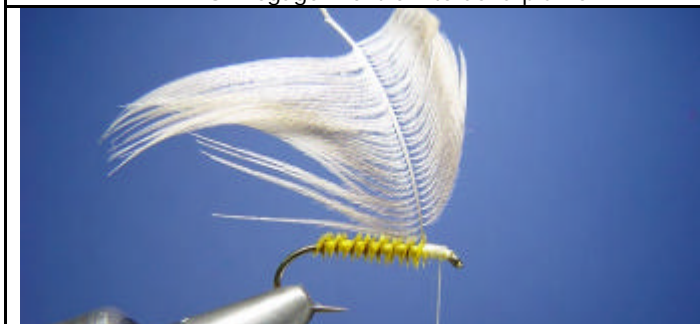
ETAPE 7 : Attachez la plume.