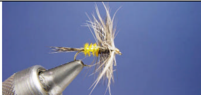
Finissez la mouche par un noeud final et une goutte de super glu.