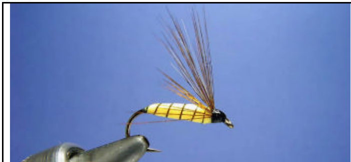
ETAPE 21 : Finissez la mouche avec un noeud final et de la super glu.