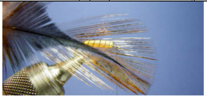
ETAPE 14 : Prenez une plume de pardo