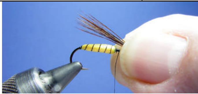
ETAPE 15 : Prélevez un paquet de fibres de pardo.