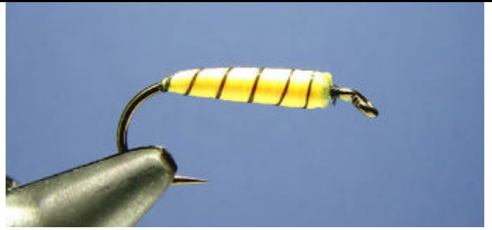
ETAPE 12 : Arrêtez la polyfloss jaune avec le fil de montage.