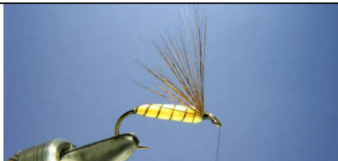
ETAPE 17 : Coupez la base des fibres.