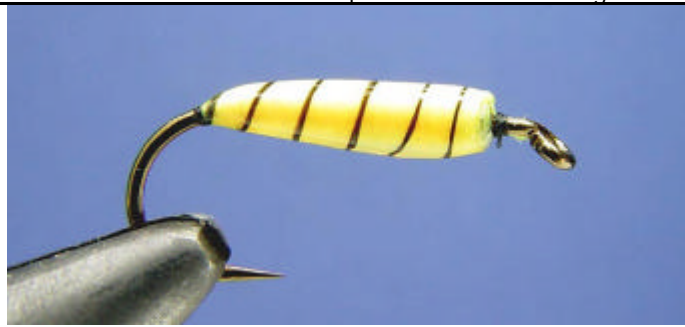
ETAPE 13 : Vernissez le corps