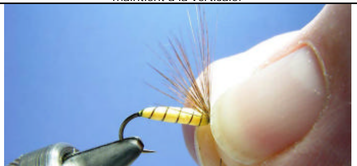
ETAPE 18 : Avec votre ongle écartez les fibres.