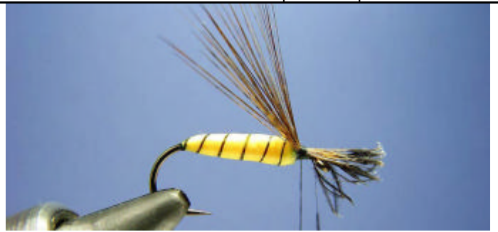
ETAPE 16 : Attachez les fibres de façon à ce que le corps les maintient à la verticale.