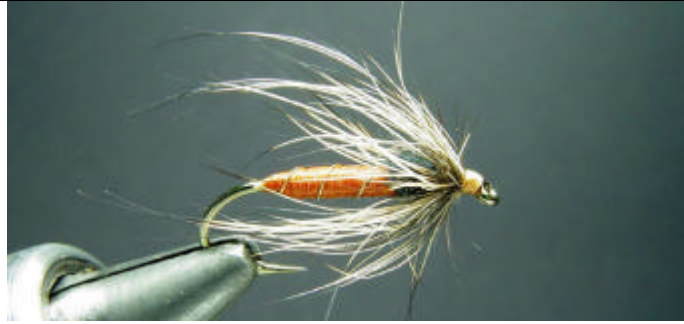
ETAPE 11 : Finissez votre mouche par un noeud final et une goutte de cyanolite.