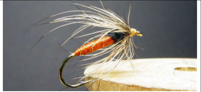
ETAPE 12 : Mouche terminée.