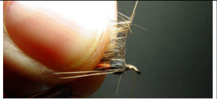
ETAPE 10 : Commencez l'enroulement et tirez vers l'arrière tous les poils de lièvre.