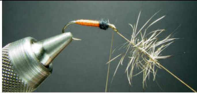
ETAPE 9 : Torsadez les poils de lièvre.