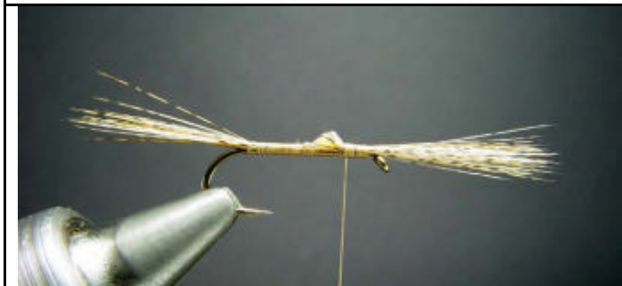
ETAPE 5 : Coupez la bases de fibres de pardo et écrasez les avec le fil de montage.