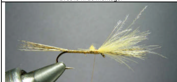
ETAPE 7 : Attachez le CDC au dessus des fibres de pardo et assurez-vous qu'il sera de la même longueur.