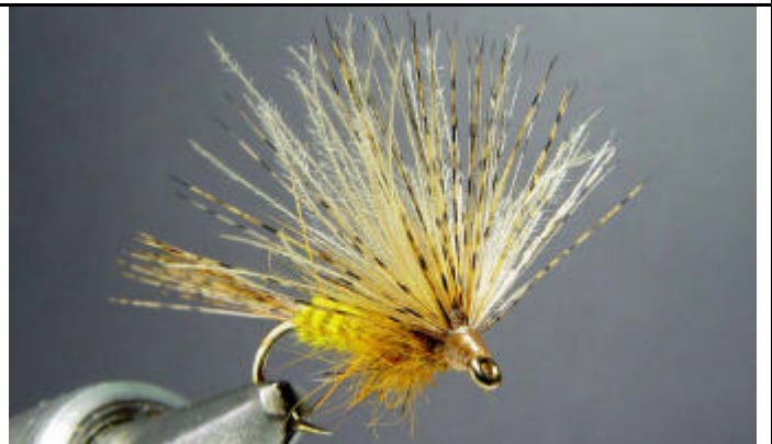
ETAPE 14 : Finissez votre mouche par un noeud final et une goutte de super glu.