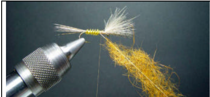
ETAPE 9 : Enroulez le quill puis placez dans un dubbing loop une mèche de dubbing de lièvre jaune.