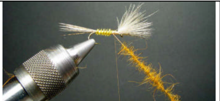
ETAPE 10 : Torsadez le dubbing.