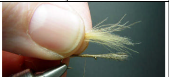
ETAPE 6 : Prenez une touffe de CDC jaune olive.