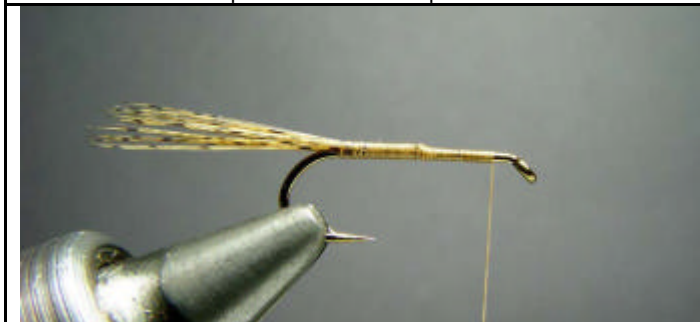
ETAPE 3 : Faites un enroulement de fil de montage jusqu'à l'oeillet.