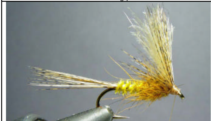
ETAPE 13 : Avec le fil de montage formez la tête tout en poussant les fibres vers l'arrière.