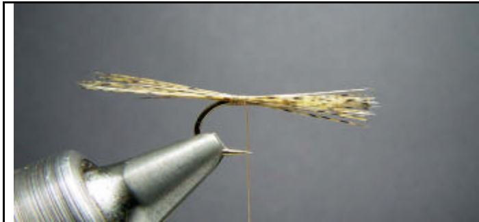
ETAPE 1 : Placez dans votre étau un H 14 puis faites une queue en fibres de pardo.

Excellente mouche qui est la limite de la mouche sèche. Vous pouvez monter cette mouche sur des hameçons n°18 à n°14. Vous pouvez changer la couleur du corps et du dubbing.