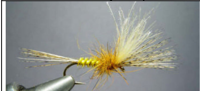
ETAPE 11 : Enroulez le dubbing pour former le thorax.