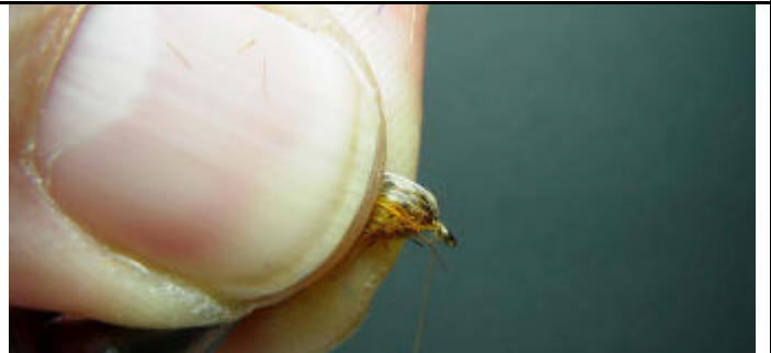
ETAPE 12 : Rabattez toutes les fibres en arrière.