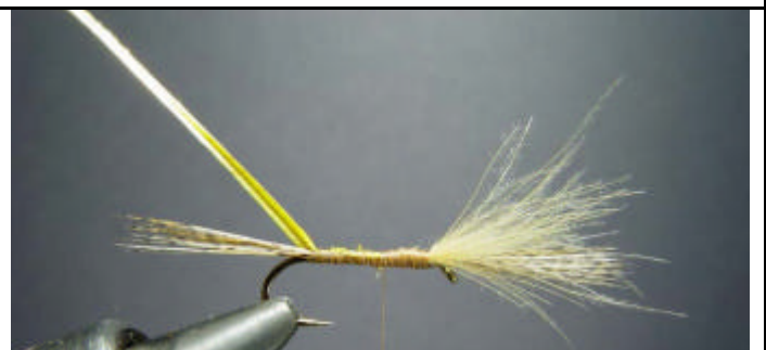
ETAPE 8 : Attachez un quill teinté jaune.