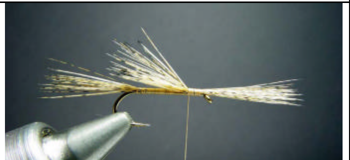
ETAPE 4 : Attachez une touffe de fibres de pardo les pointes dirigées vers l'avant.