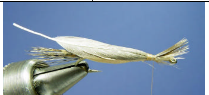
ETAPE 6 : Ligaturez la plume à son extrémité. Evitez de faire des plis sur la plume.