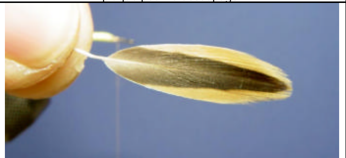
ETAPE 4 : Prenez une plume de flanc de cane vernis.