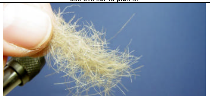
ETAPE 8 : Prenez une mèche de Dubbing de CDC.