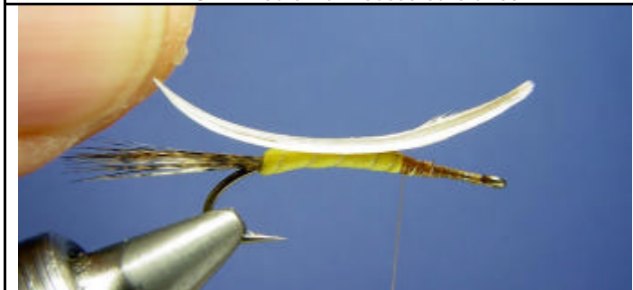
ETAPE 5 : Placez la plume au dessus de l'hameçon face extérieur vers le bas.