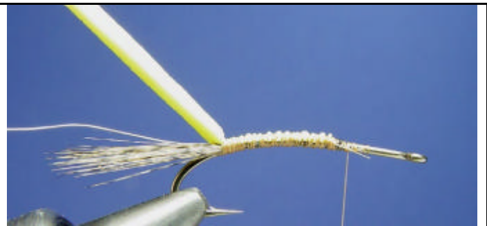
ETAPE 2 : Attachez sur le corps un tinsel argent fin plus une bande de mousse jaune. Je trouve cette mousse jaune dans les papeteries au rayon jeux des enfants. C'est vendu en plaque pour le découpage.