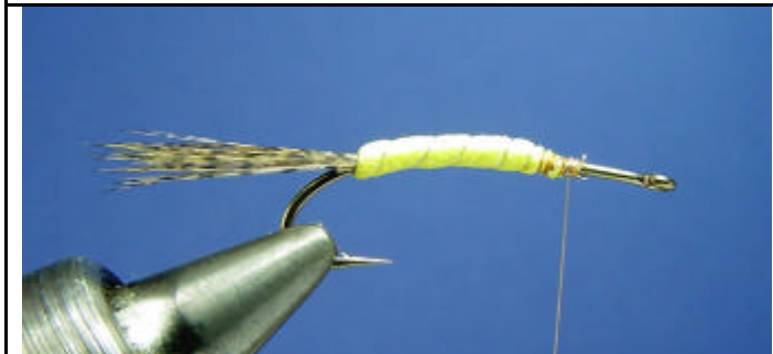
ETAPE 3 : Enroulez la mousse et le tinsel.